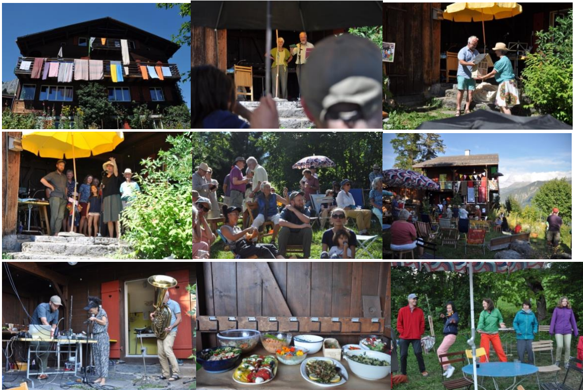
Heuerbergfest 2022: eine feierliche Hausübergabe und -nahme mit Gästen aus Braunwald und dem Unterland!