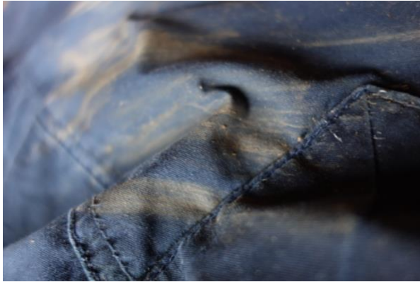
AIR Nov 2022: der fall (heuerberg)