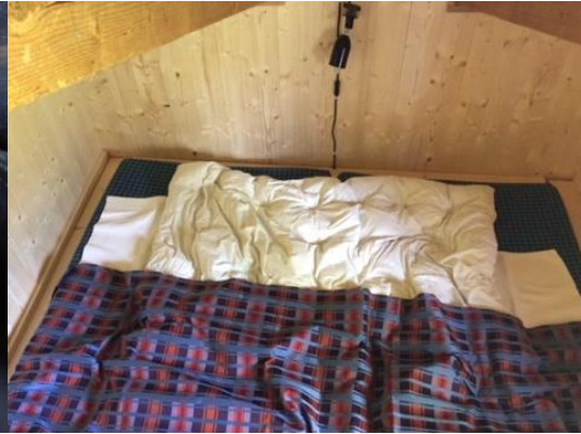
Die neue Bergmansarde ist der Hit, besonders beliebt bei Kindern